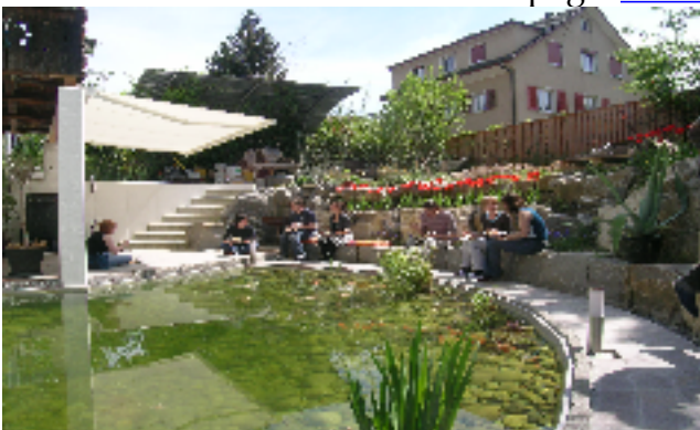
Mittagsverpflegung am Teich vor dem Kursraum

Fokus: Homöopathie im Praxisalltag. Gruppengrösse auf 15 beschränkt, interaktives Lernen, persönliche Betreuung durch die DozentInnen, gutes Lern- und Gruppenklima, angenehmes Ambiente, Pausenverpflegung inclusive. Persönliche Betreuung vor Prüfung und während der Weiterbildungs- und Praktikumsphase. Weitere Details siehe IGEH-homepage www.igeh.ch .