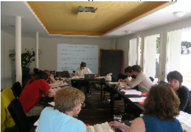
Kleingruppenarbeit im Kursraum

Die TeilnehmerInnen erhalten eine fundierte Grundlage in klassischer hahnemann'scher Einzelmittelhomöopathie, inklusive Computer- Repertorisationstechnik. Schwerpunkt der Ausbildung ist die praktische Anwendung der Homöopathie in der Hausarztmedizin. Unsere Vorzüge: Schöner Kursraum in einer homöopathischen Hausarztpraxis in Kriens-Luzern. Interaktives Lernen in Kleingruppe. Persönliche Betreuung in allen Phasen bis zum Berufseinstieg. Gesamter Prüfungsstoff in Skript-Form. Einstieg, Pausen und Ausstieg jederzeit möglich. Ebenso kostenloses „Schnuppern“ im Umfang von zwei Kurseinheiten. Rücksichtnahme auf Budget und Zeitpläne der Studierenden und AssistentInnen. Gute Prüfungsergebnisse (Bisherige Erfolgsrate: 100 % haben bestanden).