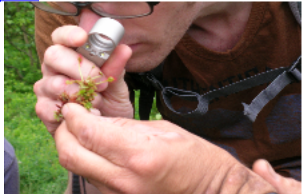
Eine Drosera wird genau beobachtet