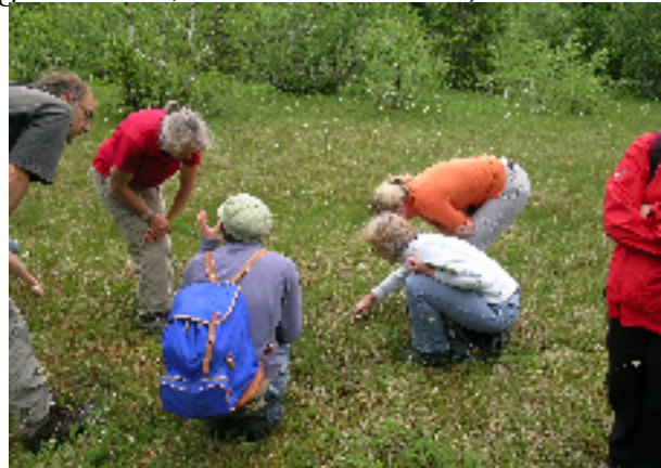
...und im Feld